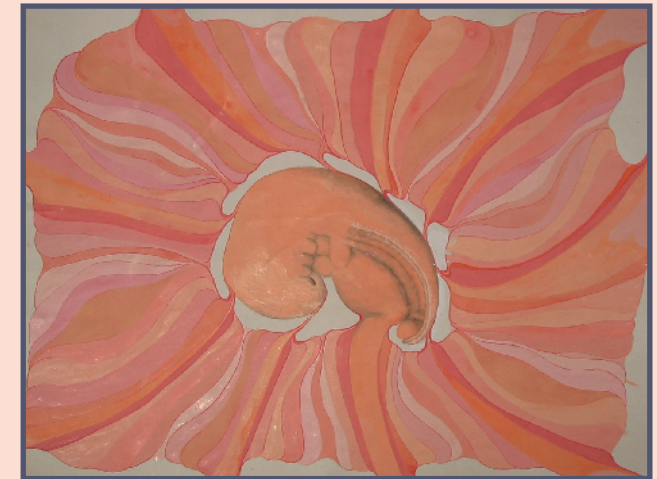
Bild: aus einer Atemsitzung